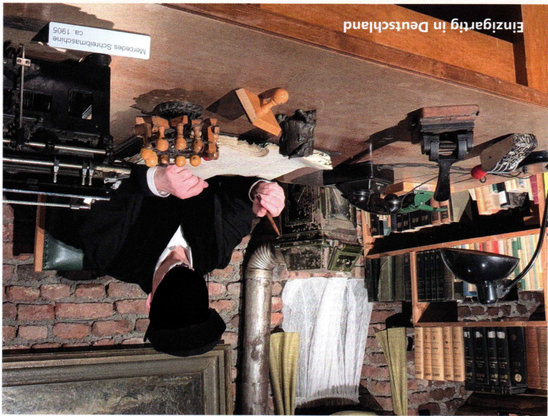
Einzigartig in Deutschland