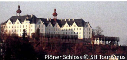
Plöner Schloss